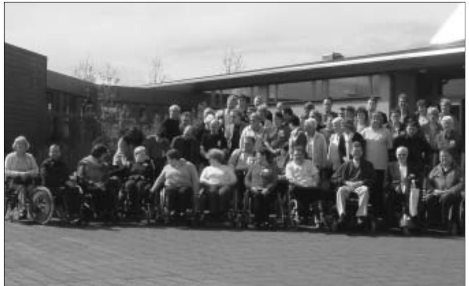
Hópurinn samankominn fyrir utan Hótel Flúði í Hrunamannahreppi. Þingið sátu 45 fulltrúar frá 14 aðildarfélögum auk starfsfólks landssambandsins og Sjálfs-

Loks gat hann nýbreytni sem bæjarstjórnin í Hveragerði tók upp um síðustu áramót við endurskipulagningu á nefndum bæjarins. Þá voru skipulags- bygginga- og brunamálanefndir sameinaðar í eina og fer-