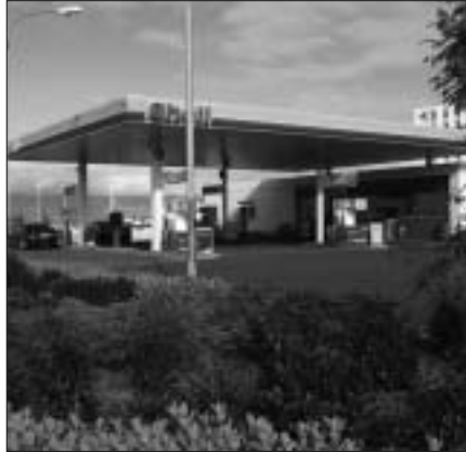
Handhafar „stæðiskorta“ fá sjálfsafgreiðsluafslátt af eldsneyti í fullri þjónustu á Shellstöðvunum um allt land.

Handhafar stæðiskorta sem framvísa Shell vildarkorti munu fá afgreitt eldsneyti í fullri þjónustu á sjálfsafgreiðsluafslætti á milli kl. 7.30 og 19.30, þar sem eingöngu er boðið upp á þjónustu fram til kl. 19.30 á kvöldin. Afslátturinn verður reiknaður sjálfkrafa út auk þess sem vildarpunktur færast á viðkomandi í