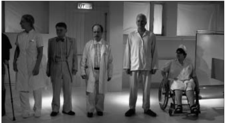
Með sýningu sinni á Fílamanninum festir Halaleikhópurinn sig enn betur í sessi sem áhrifamikil „öðruvísi“ leikhús, segir m.a. í leiklistargagnrýni Morgunblaðsins.

Fílamaðurinn, sem er eftir Bernard Pomerance, fjallar um þekktu