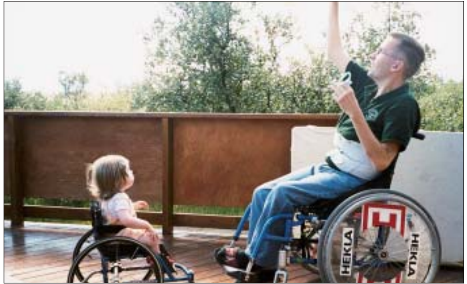
Að setja upp flugdreka með þabba.