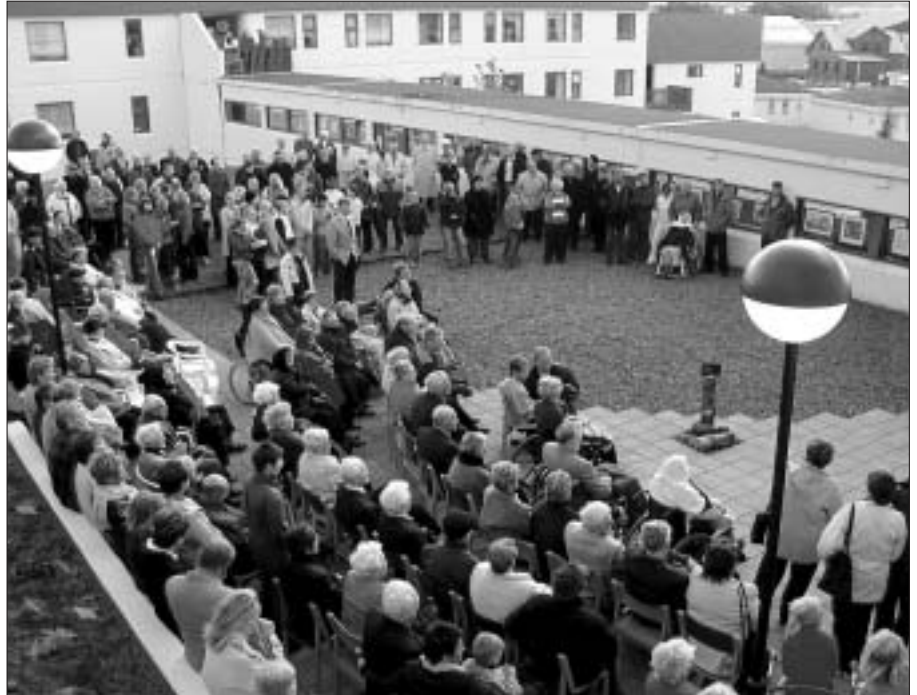
Félagsleg samskipti milli allra hópa samfélagsins eru þroskandi og gefandi. Við eigum öll okkar lífssögu og þurfum öll á því að halda að sagt sé eitthvað fallett við okkur.