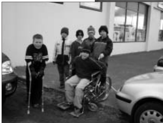
Krakkarnir könnuðu aðgengi á helstu opinberum stofnunum, þangað sem við eigum öll rétt á að sækja þjónustu.