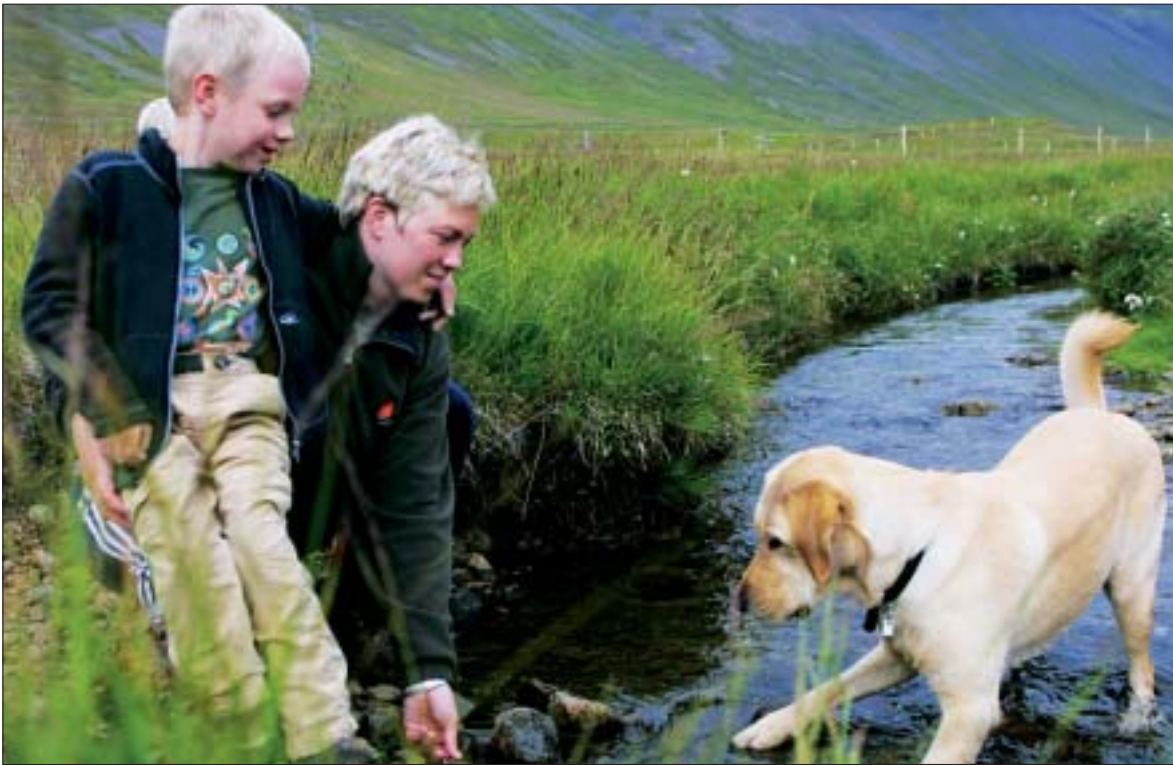
Hjálparhundurinn Tryggur með Viðari og Auði á góðri stund.